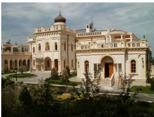
Резиденция патриарха Кирилла в Геленджике

Однако, вопреки этим заветам Господа и апостолов, многие из церковных властей поступили с точностью наоборот. Вступив на путь служения, они не только окружили себя земными сокровищами, но ещё и для представительности обеспечили себя поистине царскими резиденциями. Всем известно, например, великолепие Ватикана, но не все знают о не менее великолепных летних резиденциях православных патриархов всея Руси, в частности, патриарха Кирилла, который к имеющимся патриаршим резиденциям добавил ещё две - под Геленджиком и в Переделкино. Похожие на фантастические дворцы, сошедшие со страниц волшебных сказок, они, кажется, претендуют на обеспечение патриарху райских условий уже здесь, на земле.