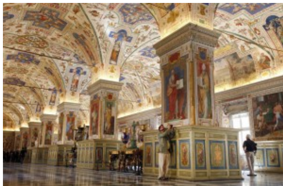
Один из залов Ватиканского дворца

Конечно же, принимая подношения или подарки, слабых не поддержишь. И тем не менее церковным властям, кажется, блаженнее принимать, нежели давать , особенно бедному. Из века в век такие представители Церкви копили земные сокровища и украшали ими свои храмы и дворцы, силясь внешней красотой поразить воображение простых людей и таким образом заполнить отсутствие в себе чисто христианского духа. Изысканные и полные великолепия интерьеры их дворцов как бы созданы для услаждения ума и чувств их обитателей. В них нет