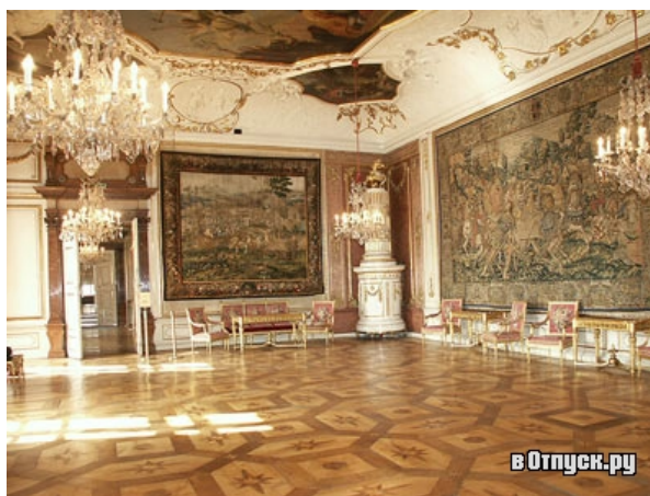
Резиденция архиепископа Зальцбург (город) Зал для аудиенций

места бедному и угнетённому, а тихое сияние Святого Духа заменено ложным блеском золота и серебра, которыми обшиты мебель, стены, потолки этих амбициозных дворцов, а также одеяния «служителей» Церкви. Так что простоты Христовой там нет и следа.