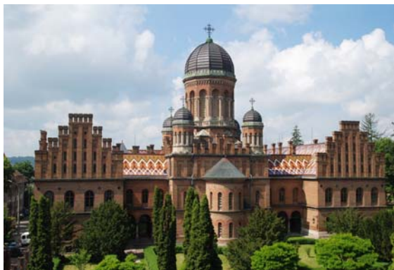
Резиденция буковинско-далматских митрополитов в Черновцах

От пап римских и православных патриархов не отстают и многие из нижестоящих чинов Церкви: кардиналы, архиепископы, митрополиты, живущие в условиях царской роскоши. Вспомним, например, обитель зальцбургских архиепископов или восхитительный дворец буковинско-далматских митрополитов в Черновцах (ныне Черновицкий государственный университет имени Юрия Федьковича) и множество других подобных обителей.