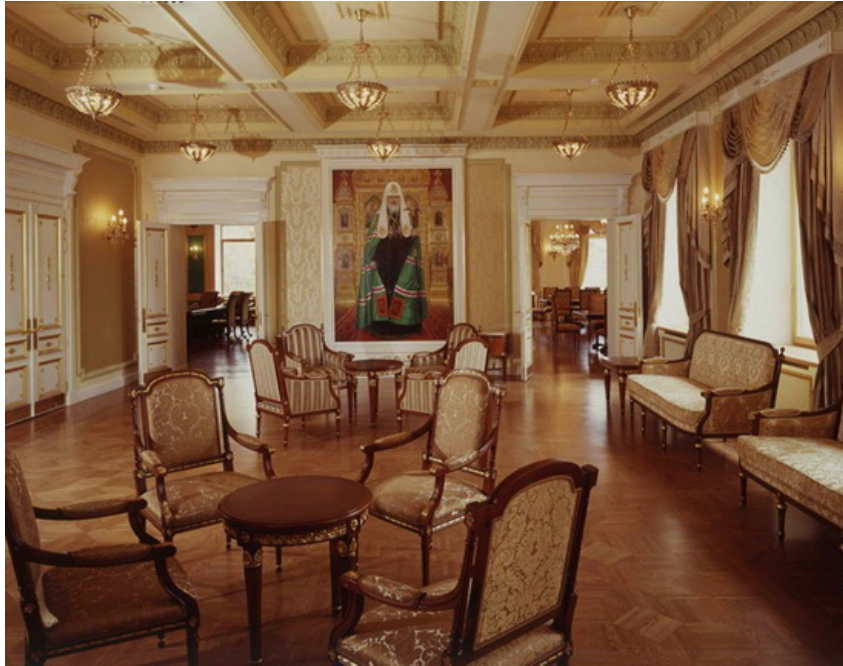
Зал с портретом патриарха во весь рост в патриаршей резиденции в Переделкино

Подобные представители церковных властей не стыдятся жить в роскоши даже перед лицом терпящей лишения паствы, и умножая свои богатства (хотя и под эгидой Церкви, сокровища которой, как известно, должны были бы быть не от мира сего), умножают тем самым свои грехи, ибо изобильное пользование благами земными чаще всего способствует расцвету похотей в человеке. Как говорил апостол Павел,